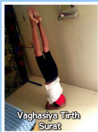
Vaghasiya Tirth Surat