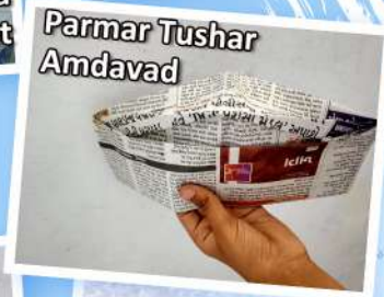
Parmar Tushar Amdavad