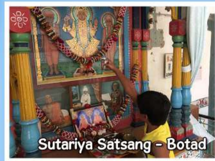
Sutariya Satsang - Botad