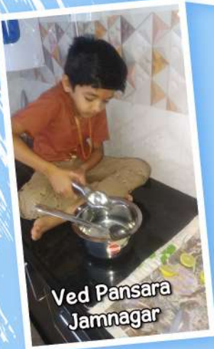
Ved Pansara Jamnagar