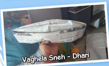
Vaghela Sneha - Dhari