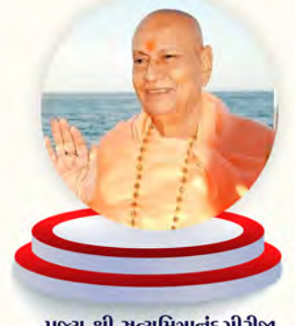
પૂજ્ય શ્રી સત્યમિત્રાનંદગીરીજી

જરૂરી સામગ્રી : મોબાઈલ, કાગળ, પેન કોણ જોડાશે : ફક્ત તમે